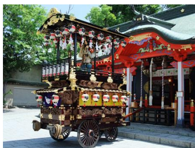
▲中町2丁目舞台（松本市）