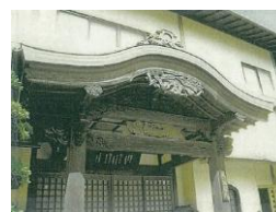
▲阿弥陀堂新築工事（松本市）